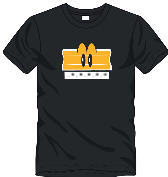
□ ■ 2 COLORI