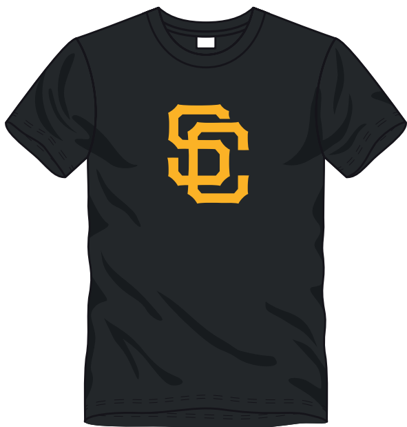
■ 1 COLORE

Ecco alcuni esempi per aiutarti a capire a quanti colori è la grafica che vuoi stampare. Ricordati che i colori che visualizzi nel tuo schermo possono variare in base alla tipologia e alla risoluzione del tuo monitor. Se hai esigenze particolari, con un piccolo sovrapprezzo, potrai inserire dei codici pantone, altrimenti fidati di noi, con la nostra esperienza realizzeremo al meglio il tuo lavoro.