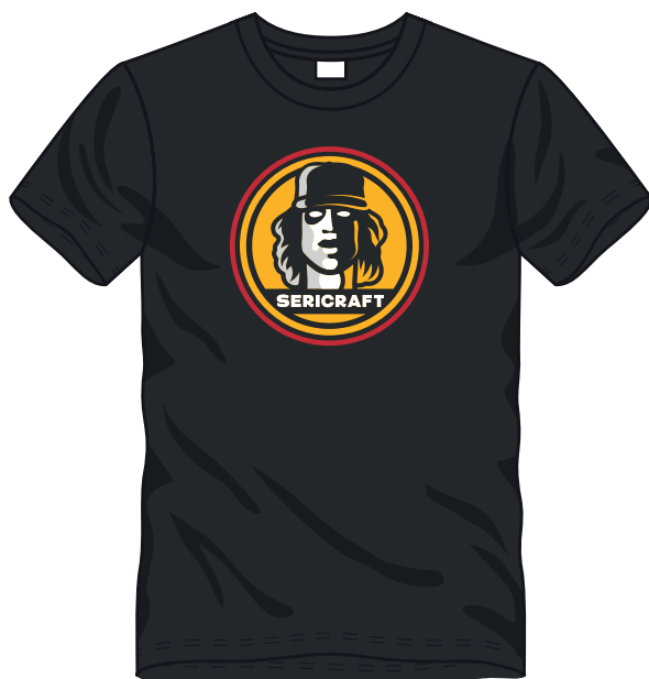
□ ■ ■ 4 COLORI