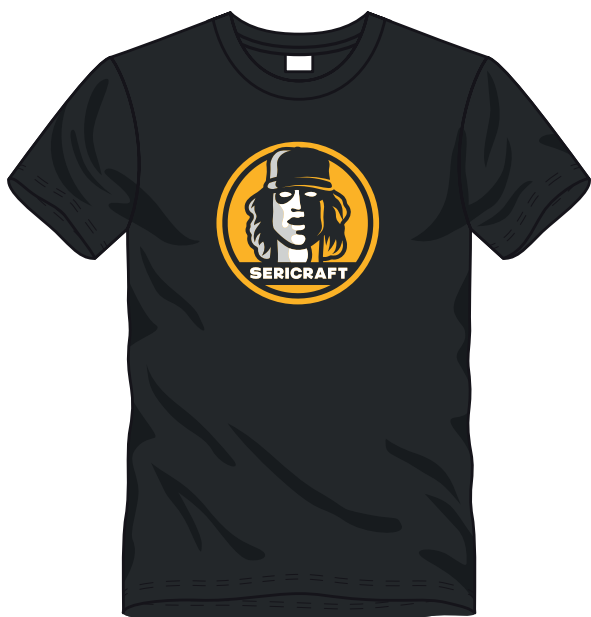
□ ■ 3 COLORI